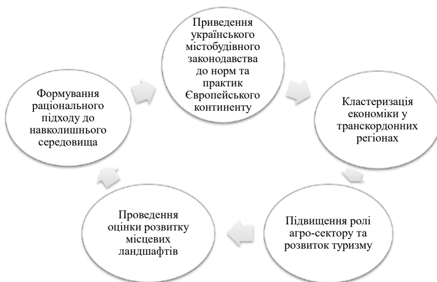
Рис. 1. Ключові пріоритети сталого просторового розвитку, виокремлені на конференції «Комплексний підхід до збалансованого сталого просторового розвитку Європейського континенту» у 2009 р.

Метою конференції 2009 року була популяризація інтегрованого підходу до міського та регіонального планування, результативного публічного управління на місцевому та регіональному рівнях. На конференції розглядалися питання щодо впровадження рекомендацій Керівних принципів сталого просторового розвитку Європейського континенту (затверджених у 2000 р. на конференції СЕМАТ «Керівні принципи просторового планування та стратегія сталого розвитку Європи»), а також розробці пропозицій для підготовки до 15-ї конференції СЕМАТ, яка відбувалася наступного року. У рамках конференції, 12 червня 2009 р., відбулося 90-те засідання Комітету вищих посадових осіб СЕМАТ, а також засідання робочої групи з питань реалізації ініціативи щодо сталого просторового розвитку в басейні річки Тиса (у розвиток рішень конференції СЕМАТ «Реалізація стратегій і візій сталого просторового розвитку європейського континенту» у 2003 році). Результати обговорення містили ряд ключових положень, які можна виокремити, як пріоритети сталого просторового розвитку, як були актуальними на 2009 р. (рис. 1).